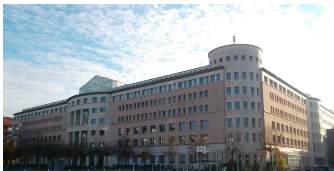
Uni-Mail 1 er étage

Objet : Rénovation partiel de l'éclairage de l'Uni-Mail. Surfaces rinnovées : Auditorioes, couloirs, Sanitaires, extérieur et bibliothèque Maître de l'ouvrage : DI / OBA Personne de référence : M. Anchanté et Baur (OBA), tél. 022 546 62 43 / 51 Année du mandat : 2013-2020 Année des travaux : 2018-2020 Prestations effectuées : Phases SIA 3, 4, 5 Coût de l'ouvrage : CFC 23 : Fr. 1'058'500.— CFC 233 : Fr. 1'053'000.— Type de travaux : Remplacement de l'éclairage incluant une gestion locale Dali, KNX/Dali ou AMX selon les surfaces Responsable mandat : Eric Perret, tél. 022 787 22 29 Partenaires du mandat : Bureau Zid (architectes) pour la bibliothèque